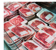
CARNES Y MARISCOS