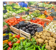
FRUTAS Y VEGETALES