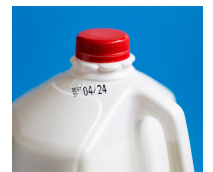
LÁCTEOS Y HUEVOS